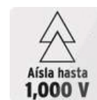
Aísla hasta 1,000 V