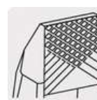
Mordazas con moleteado cruzado