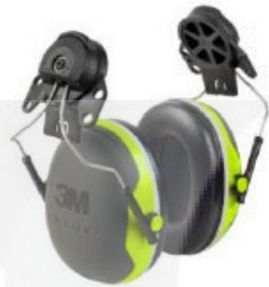
X4P3E Arnés para casco (236 g.)