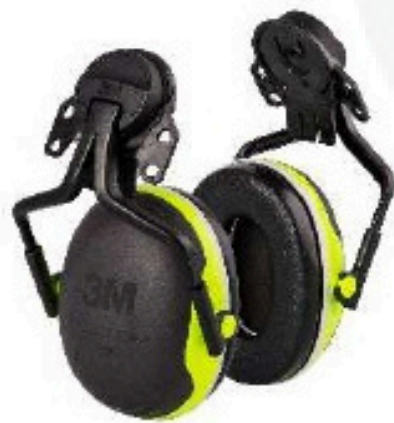
X4P5E Arnés con Aislamiento Eléctrico Para Casco (235 g.)