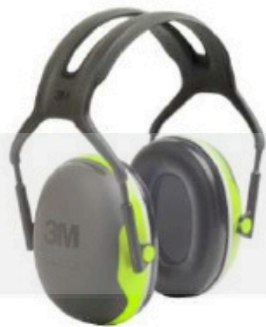
X4A Arnés sobre la Cabeza (234 g.)