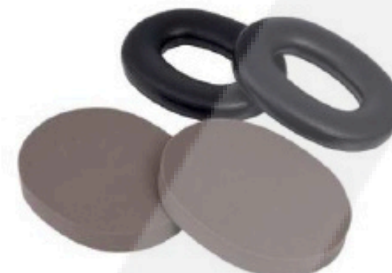
Kit de Higiene HYX4

3M pone a su disposición el Kit de Higiene HYX4, el cual le permitirá cambiar de manera rápida las almohadillas de los fonos si ellas presentan roturas, pliegues, deformaciones permanentes o rigidez en su parte exterior, sin que ello implique cambiar la unidad completa.