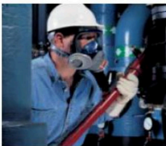
Configuración de dos puertos con combinación de cartuchos.

Su diseño se basó en medidas de características faciales de más de 8,000 personas.