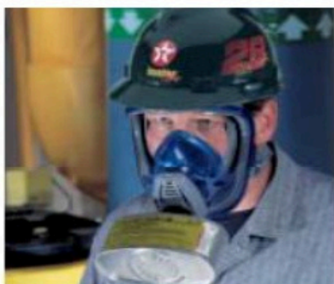
Configuración de un puerto con canister para máscara de gas estilo barbiña.